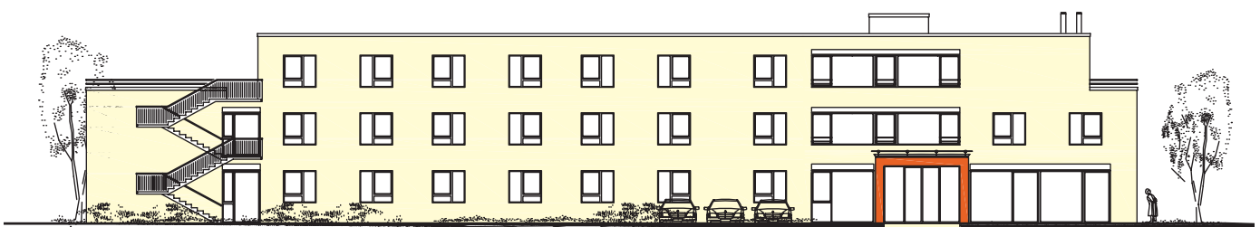
Haus Schauinsland, Pflegeheim