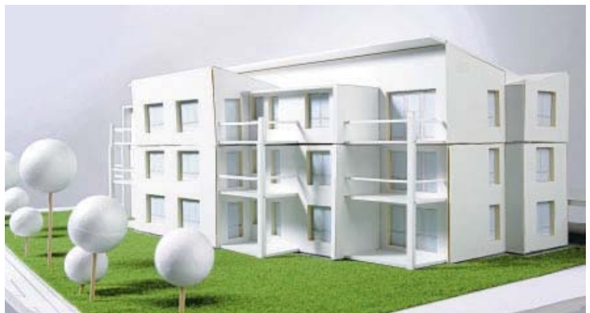
Firma Tico, Wohnen mit Service