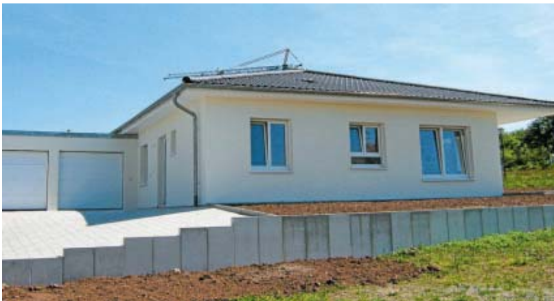
Wohnchalets, Geoteam Ingenieure Zoll/Ingenieurbüro Vogel

Auch hierzu laden wir - auch im Namen unserer Partner - die Bevölkerung recht herzlich ein.