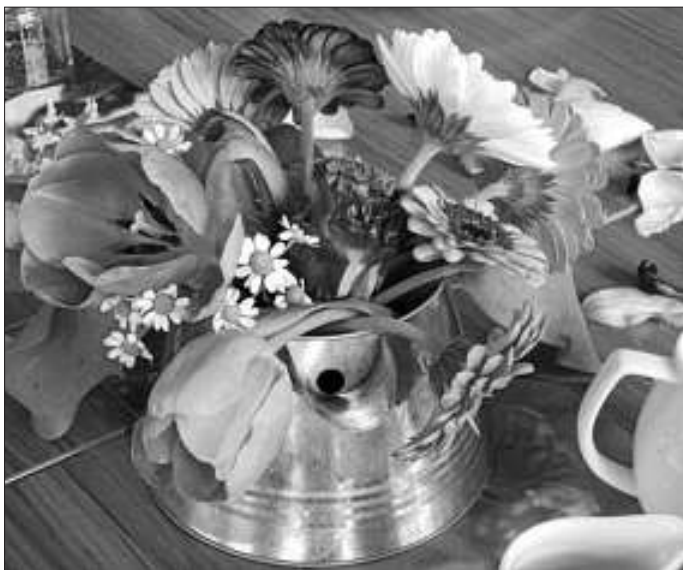
„Frühlings-Erwachen“ im Haus Schauinsland Tiefenbronn

Letzten Freitag - eine Woche vor Frühlingsbeginn - feierten die Bewohner im Haus Schauinsland Tiefenbronn zusammen mit ihren Familienmitgliedern und den Mitarbeitern das Erwachen des Frühlings.