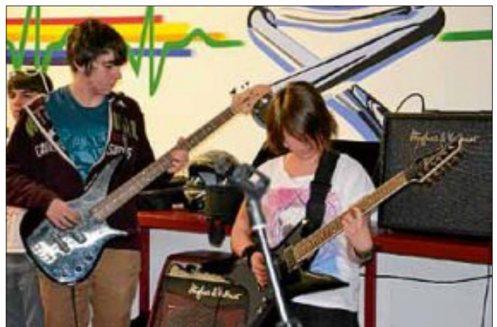
Darüber hinaus waren Elemente aus einem Zirkusprojekt zu sehen, das in der Themenwoche stattgefunden hatte: Zirkuschor, Zirkusdirektor, Clowns, Zauberer, Jonglage und Würfelbechertricks, Einradfahrer und Menschenpyramiden. Da wurde doch einiges geboten.