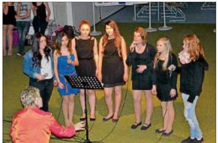
In den Präsentationen ging es einerseits um musikalische Darbietungen der VIB-Vocalists und der VIB-Band „The Bietles“, die im neu eingerichteten Bandprobenraum spielte, der auch in Zusammenarbeit mit Schülern in der Themenwoche entstanden war.