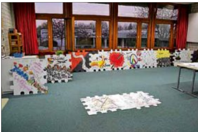
Ein anderes Klassenzimmer beherbergte eine Ausstellung mit bunt bemalten oder beklebten Sitzhockern, die ein Gewicht bis zu 120kg zulassen – sie werden zukünftig in unseren Fluren zu finden sein. Die schönsten Stücke stellen wir in der Vitrine aus.