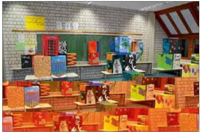
Die 10. Klassen stellten selbst gestaltete Handys aus. Auch ein Literaturprojekt und Gedichtwände konnten begutachtet werden.