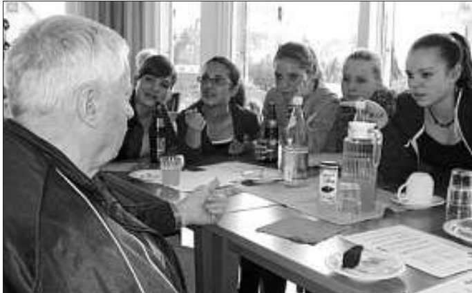
Ein gelungener Nachmittag, an dem „Alt“ und „Jung“ großes Vergnügen hatten!

Was die Schülerinnen und Schüler dabei geboten haben verdient Respekt: Sie haben für die Senioren Lieder ausgesucht und gemeinsam mit ihnen gesungen, sie haben eigens Sketche einstudiert und aufgeführt, sie teilten selbst gebackene Kuchen aus und verteilten sich schließlich an die Tische, um mit den Bewohnerinnen und Bewohnern Brett-, Karten- und Würfelspiele zu spielen.