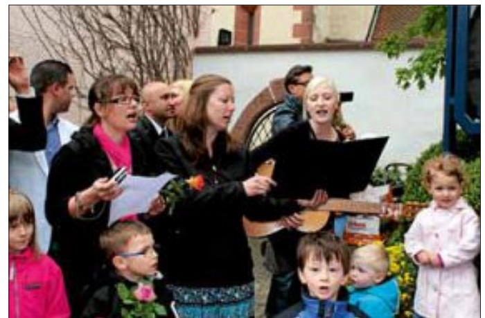
Die Erwachsenen singen mit

Die kleinen und großen „Würmtalstrolche“