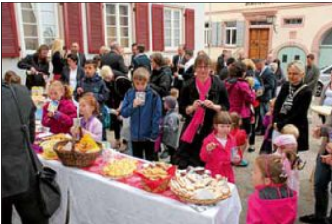
Zum Schluss der Sektempfang