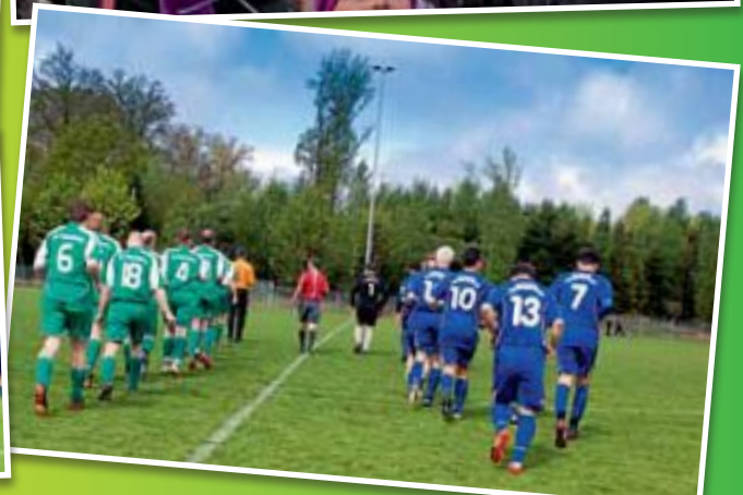
Bilder: Carlos Valdivieso