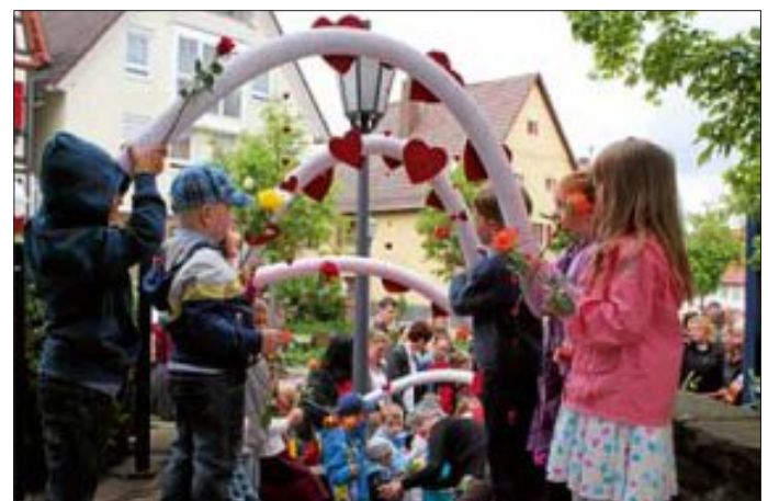
Die Kinder begrüßen das Brautpaar