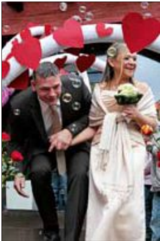
und dann kommen sie