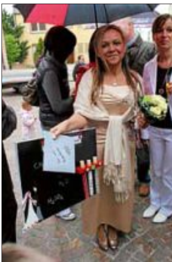
und ein Geschenk der Eltern für beide.