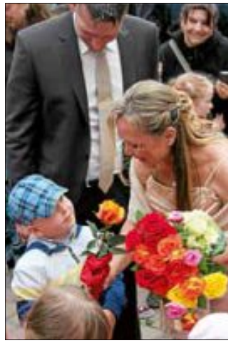
es gibt Rosen für die Braut