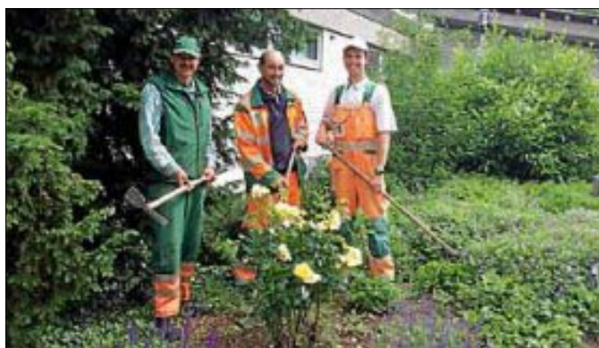
Grüntruppe Bauhof Gemeinde Tiefenbronn