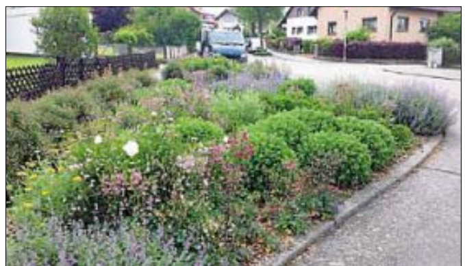
Grünbeet in der Mühlstraße