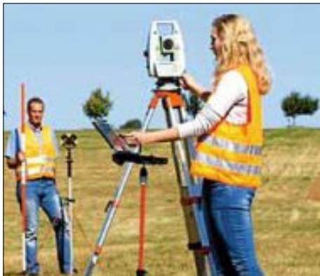
Vermessungstechnikerin: Einer der spannenden Ausbildungsberufe, für die der Enzkreis Lehrstellen anbietet.

Von Dienstag bis Freitag informiert das Landratsamt in den Enzgärten in Mühlacker über seine aktuellen Ausbildungsangebote. Besonders interessant sind die praktischen Demonstrationen, die Azubis der Bereiche Vermessung und Straßenbetriebsdienst zeigen werden.