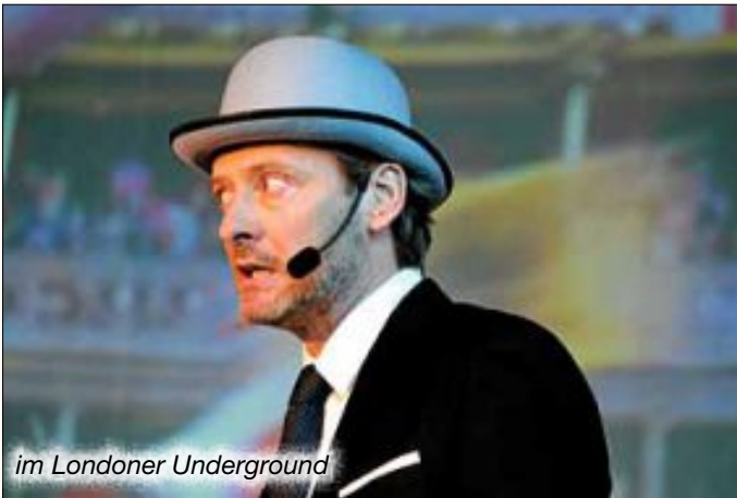
im Londoner Underground