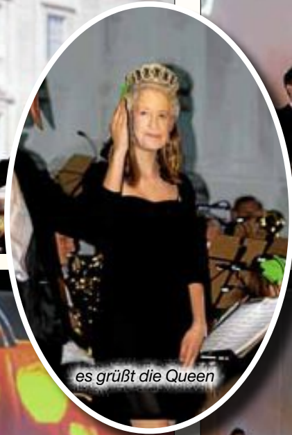
es grüßt die Queen