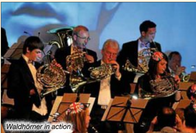
Waldhörner in action