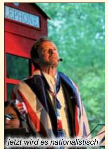
jetzt wird es nationalistisch