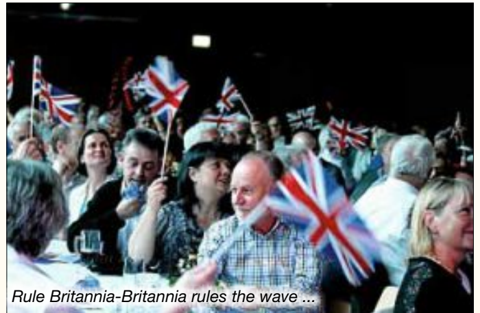
Rule Britannia-Britannia rules the wave ...