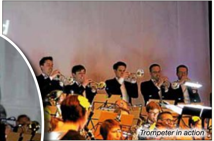
Trompeter in action