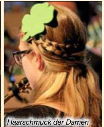
Haarschmuck der Damen

Einen Bericht zum Konzert finden Sie im Vereinsteil