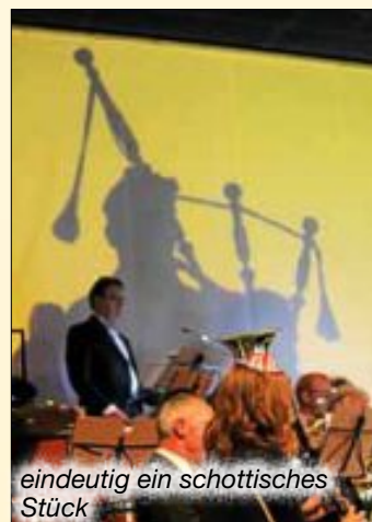
eindeutig ein schottisches Stück