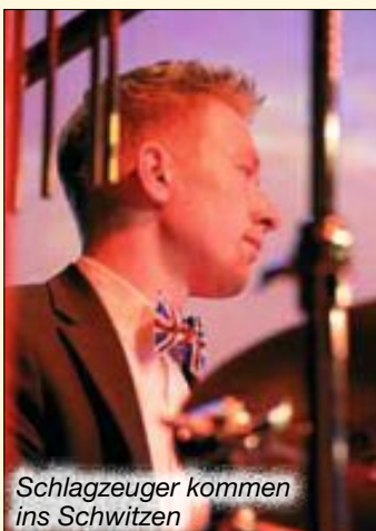
Schlagzeuger kommen ins Schwitzen