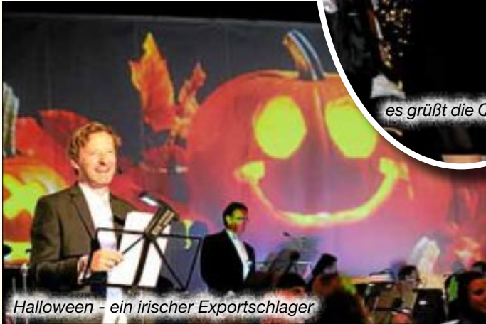
Halloween - ein irischer Exportschlager