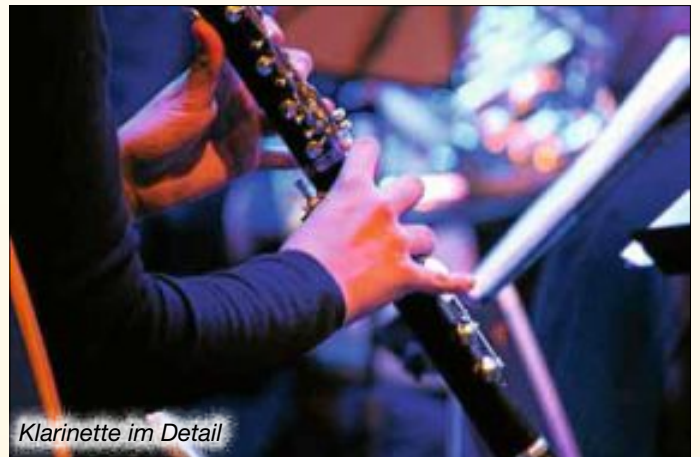
Klarinette im Detail