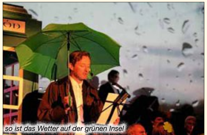
so ist das Wetter auf der grünen Insel