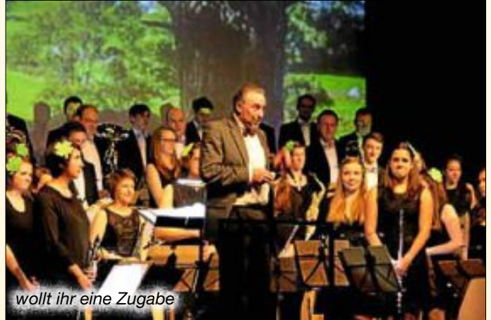
wollt ihr eine Zugabe