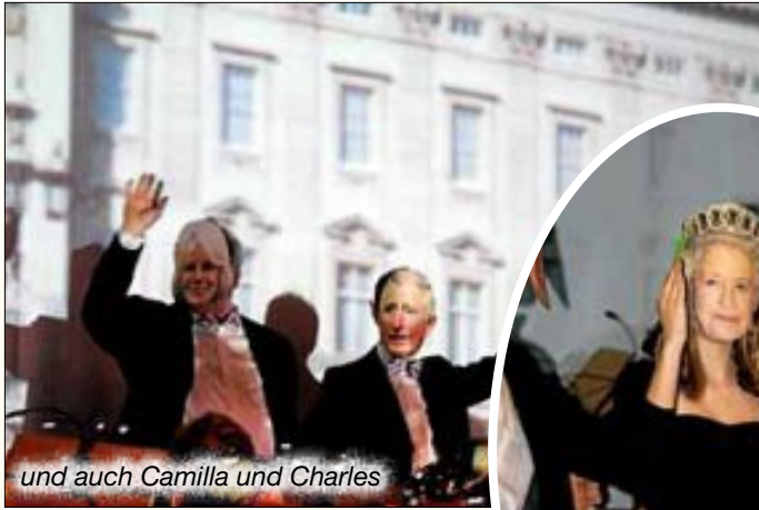
und auch Camilla und Charles