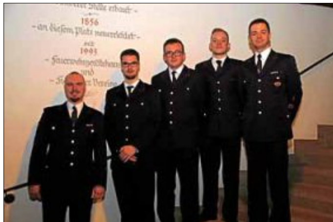
Teilnehmer vom Grundlehrgang