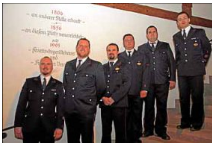
Teilnehmer vom Truppführerlehrgang