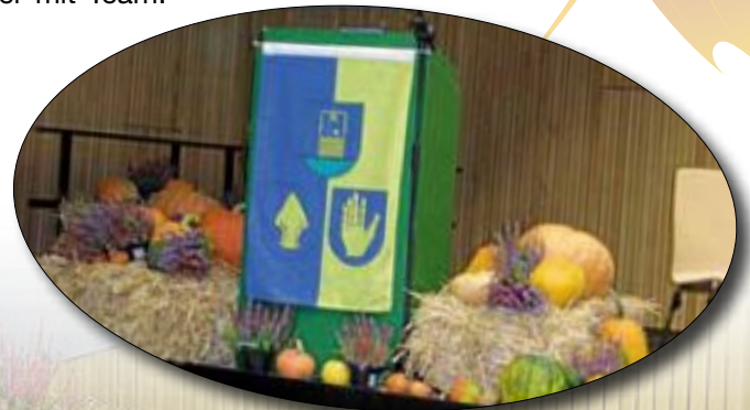
Frank Spottek Bürgermeister