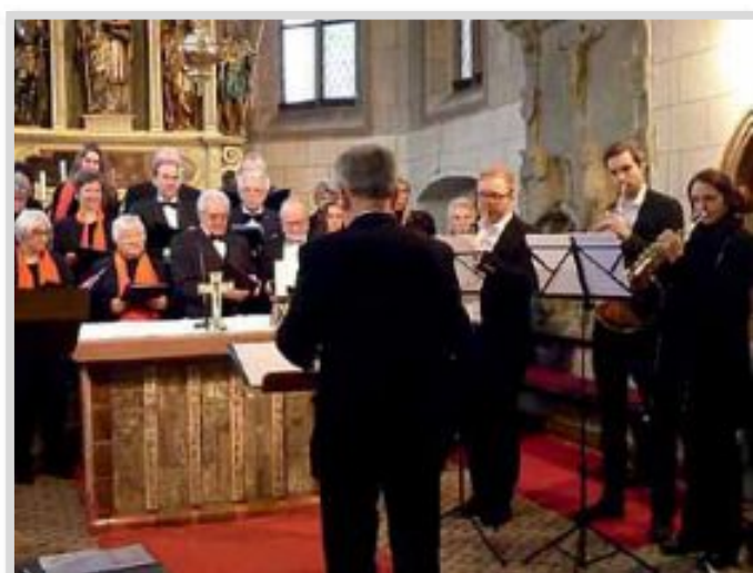
Bilder: Joh. Krämer