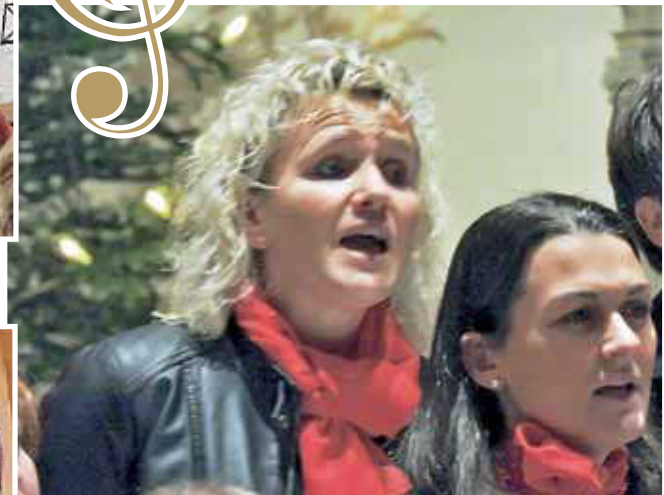
Einen Bericht hierzu können Sie im Vereinsteil lesen.