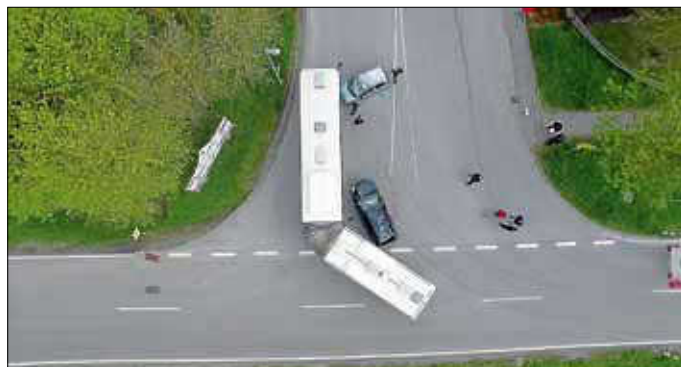
Im Einsatz: Die Feuerwehr Tiefenbronn mit vier Fahrzeugen und ca. 40 Kräften und das DRK aus Tiefenbronn und Heimsheim mit insgesamt 15 Kräften.

Das war das Einsatzszenario, welches bei der Alarmübung am Freitag, den 3. Mai 2019, im Industriegebiet Tiefenbronn simuliert wurde.