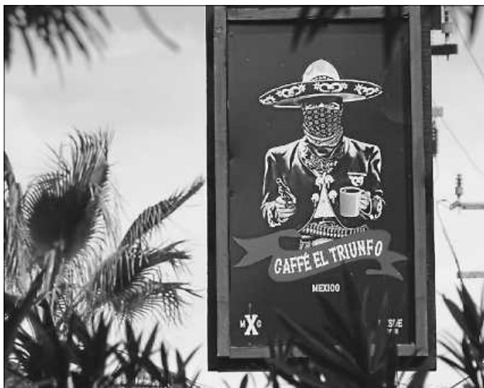
Mexiko – Aus der Sicht eines Wohnmobilreisenden