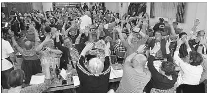
Sichtlich gute Stimmung ...