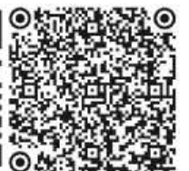
Bilder zum Spendenlauf auf Facebook