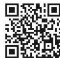
Video zum Spendenlauf auf Facebook

Mehr Bilder zum Spendenlauf auf Facebook TSV Muehlhausen e. V. und ein kurzes Video zum Spendenlauf auf Facebook TSV Muehlhausen e. V.