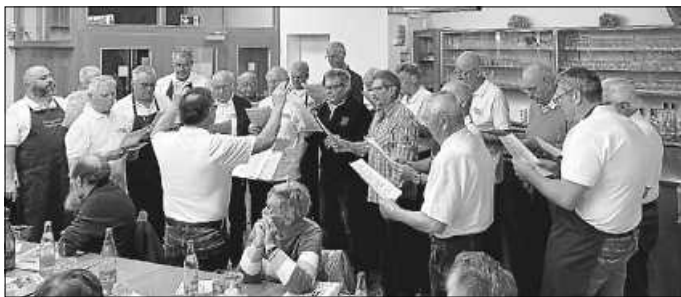
unser Männerchor voll im Einsatz