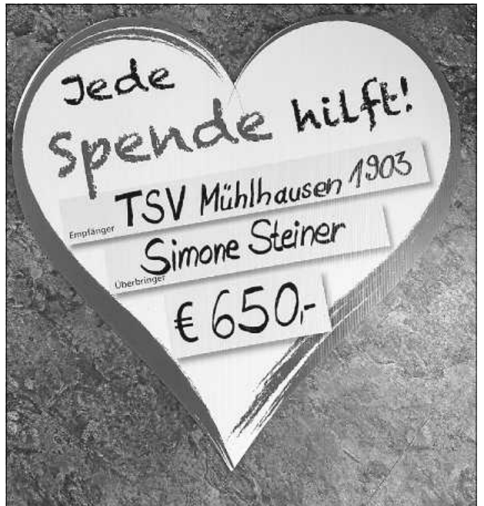
Spenden Summe

Mehr Bilder zum Spendenlauf auf Facebook TSV Muehlhausen e. V. und ein kurzes Video zum Spendenlauf auf Facebook TSV Muehlhausen e. V.