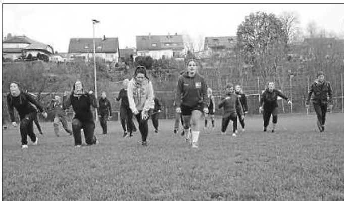
Warm-up am TSV Sportplatz

Ob Deftiges oder Süßes, jeder konnte sich ein wenig stärken.