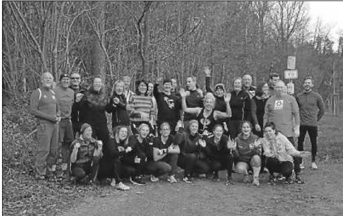
Start um 09:00 Uhr

Start um 9.00 Uhr am NEUNZEHN03 am Sportplatz des TSV Mühlhausen zum gemeinsamen warm up.