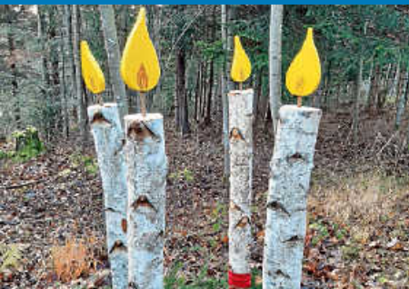
Schönen 1. Advent