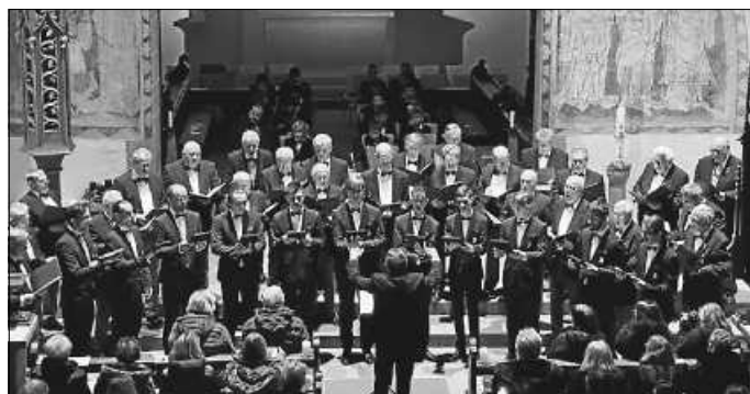
Junge Stimmen und reife Stimmen.