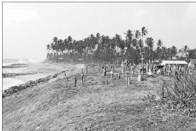
Kreuze am Strand von Hambantota erinnern an die Opfer des Tsunamis vor 20 Jahren.

Sparkasse Pforzheim-Calw IBAN: DE92 6665 0085 0007 3444 49