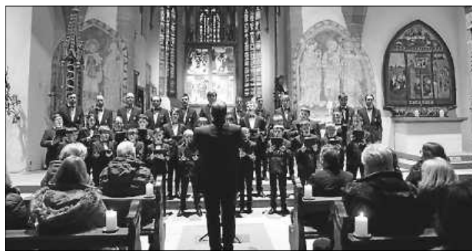
Der Aurelius Chor.