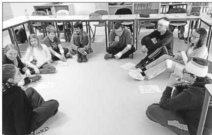
Der diesjährige Leseabend war gut besucht.

Das „andere Schulleben“, das schon immer einen hohen Stellenwert bei uns hatte, ist wieder gut am Start: Eine erneute Runde von JuleiCa-Schüler*innen konnte mit der Ausbildung starten und wieder ehrenamtliche Jobs übernehmen: In erster Linie kümmern sie sich um den Schulsanienendienst und die Streitschlichtung, „alte“ JuleiCas leiten aber auch Sport-AGs in der Mittagszeit an (Basketball, Hip-Hop, Tischtennis), engagieren sich in der VLZ und kümmern sich um Aufenthaltsräume und Spielbetreuung.