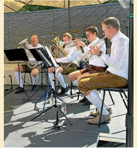
Blechquartett beim Gottesdienst