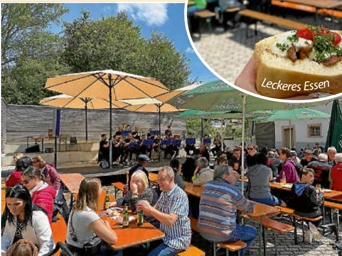
Grombierkapell des MV Merklingen