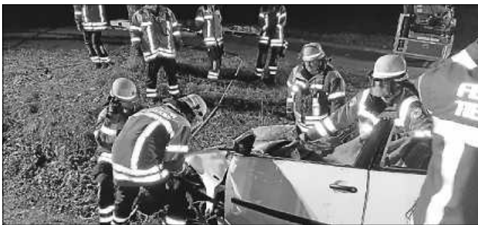
Das Fahrzeugdach ist abgeschnitten und die Tür wird geöffnet.