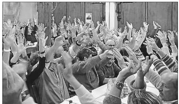
...und alle singen begeistert mit