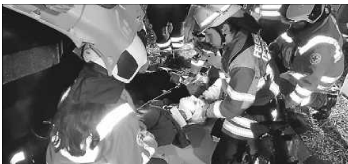
Die Schwerverletzte wird mit vereinten Kräften von DRK und Feuerwehr schonend aus dem Fahrzeug gehoben.