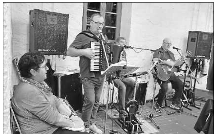
unsere „Wurmberger Wirtshausmusikanten“ im vollen Einsatz