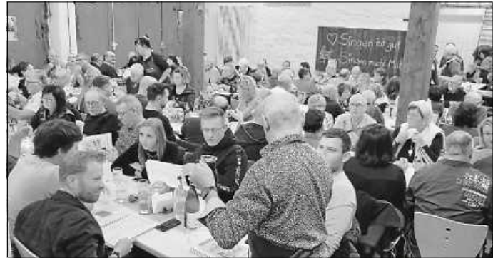
der Saal war „rappellvoll“

Singen tut gut, Singen macht Mut die Vorstandschaft