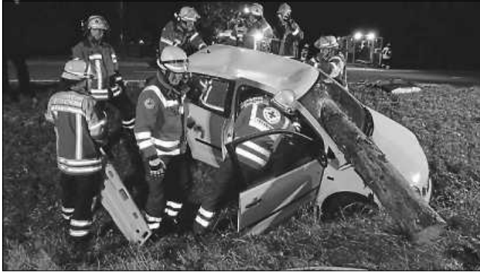
DRK-Sanitäter verschaffen sich Zugang zum Verletzten.