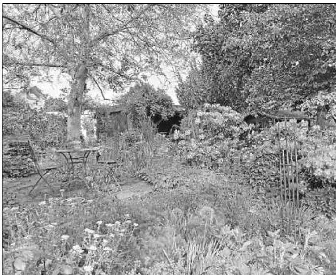
Naturnah gestaltete Gärten mit vielen verschiedenen Gehölzen und Stauden fördern die Biodiversität und bieten Lebensräume für Insekten, Vögel und Kleintiere.

Die Liste der teilnehmenden Gärten in der Region ist auf der Internetseite des Landratsamtes ( www.enzkreis.de/offene-gartentuer ) hinterlegt. Die Veranstalter weisen darauf hin, dass das Betreten der Gärten auf eigene Gefahr erfolgt. Schmale Wege, Treppen, Trittsteine und Rasenpfade sind meist nicht barrierefrei und können bei feuchter Witterung rutschig sein. Aus Rücksicht auf die Eigentümer und andere Gäste wird gebeten, keine Hunde zum Besuch mitzubringen. (enz)