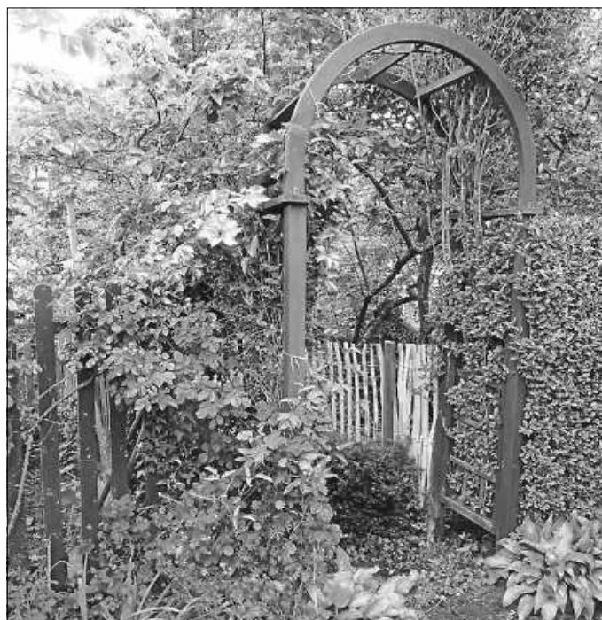
Am Tag der offenen Gartentür öffnen liebevoll gestaltete Garteneingänge den Zugang zu reizvoll angelegten Gartenparadiesen.