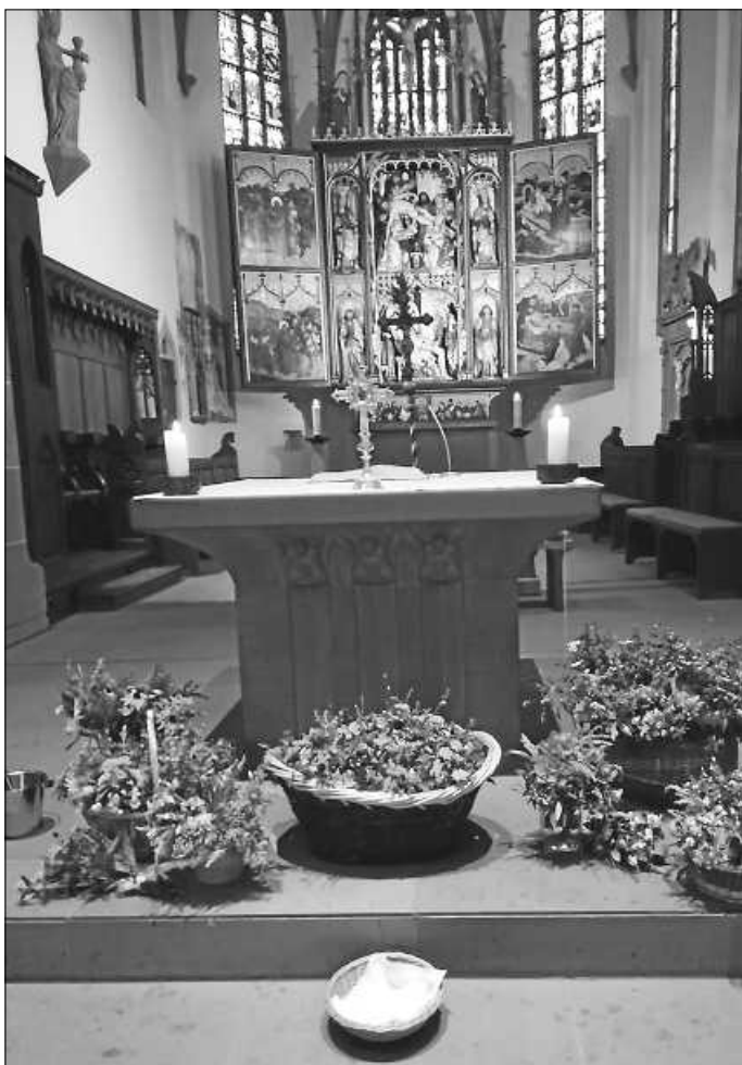
Kräuterweihe Hochfest Mariä Aufnahme in den Himmel