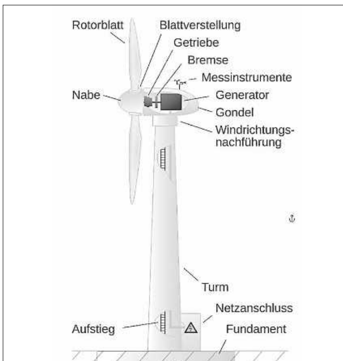
Schema einer Windkraftanlage